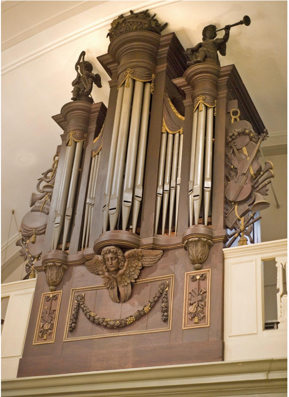
Foto van het orgel van de Catharinakerk van het begijnhof in zijn huidige, sterk aangepaste, vorm.