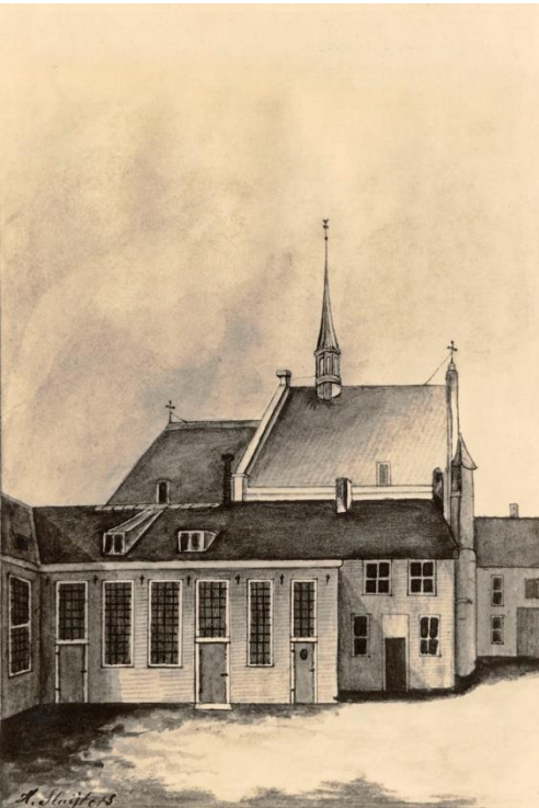
Fotoreproductie van een pentekening, gekleurd met waterverf, door H. Sluijters. Deze afbeelding toont het exterieur van de huiskerk met hoge vensters zoals die functioneerde van 1648 tot 1838. Op de achtergrond de Wendelinuskapel/ Waalse Kerk.